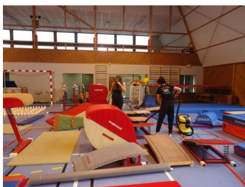
Nettoyage des moquettes