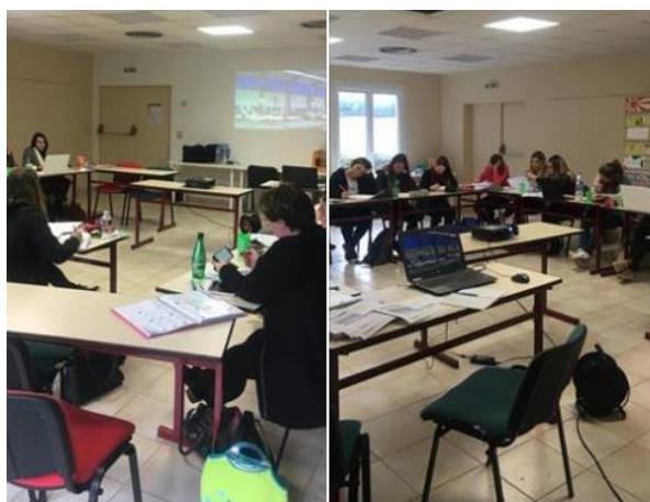
Formation BF20 option 3

Le Club finance ces formations. En contrepartie, le juge s'engage à juger pour le Club.