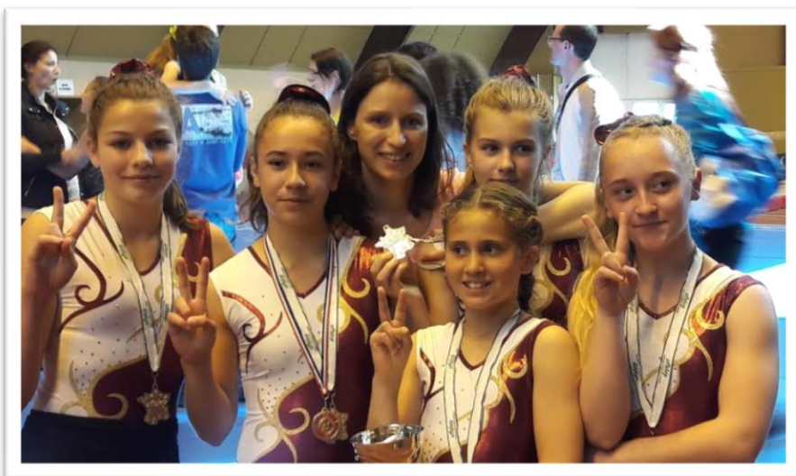
Equipe N6 7/12 ans