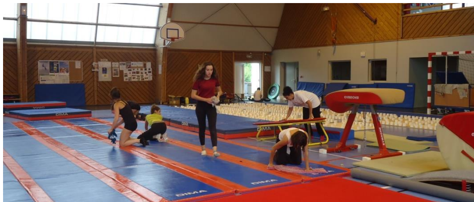
Nettoyage de la zone de stockage - Lessivage des tapis de sol et des caisses