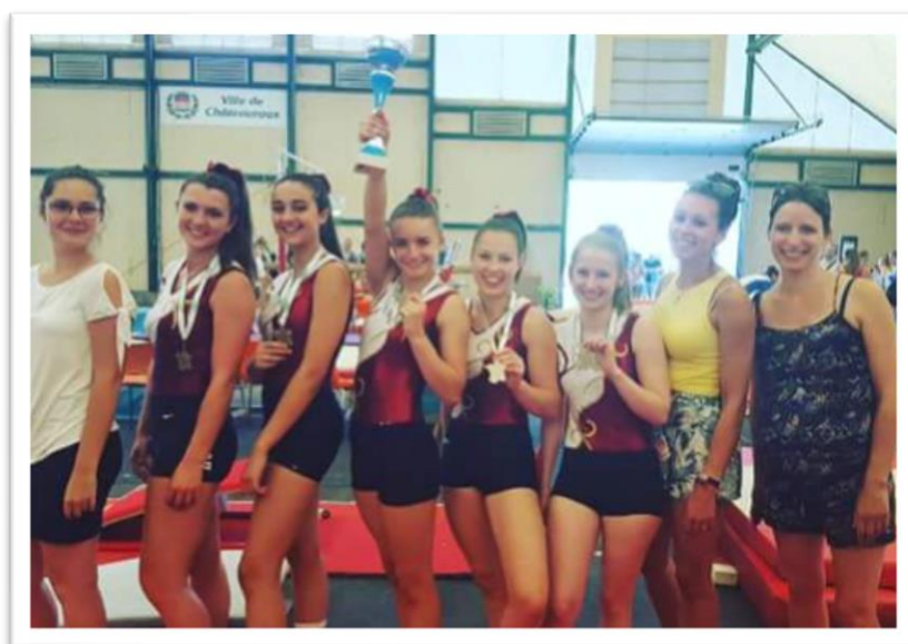
Equipe N4 14/18 ans