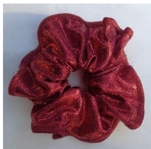
Chouchou, poudré carmin, assorti au justaucorps au prix de 3,5€

Veillez nous retourner vos bons de commande pour le vendredi 10 novembre 2017 au plus tard (à remettre à l'entraîneur, ou à nous envoyer sur la boîte mail du club).