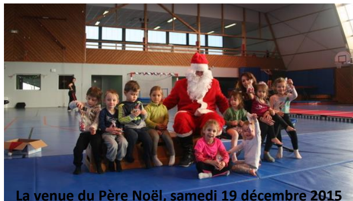
La venue du Père Noël, samedi 19 décembre 2015