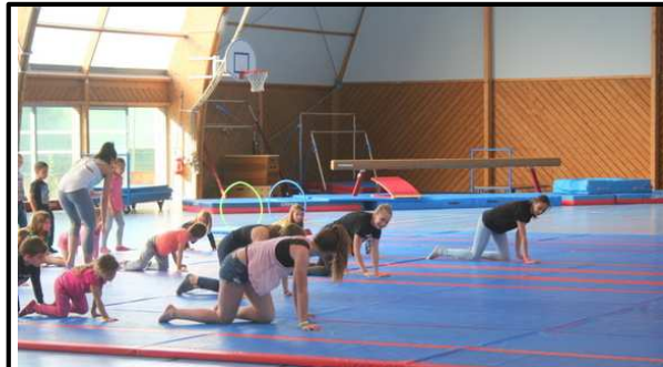
Figure 2 : l'Echauffement